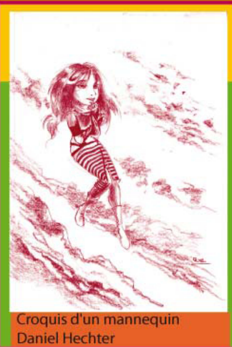
Croquis d'un mannequin Daniel Hechter

Justine et Julien, les 2 héros qui expliqueront aux enfants comment bâtir une histoire dans : J'apprends la BD Parution 2è trimestre 2010.